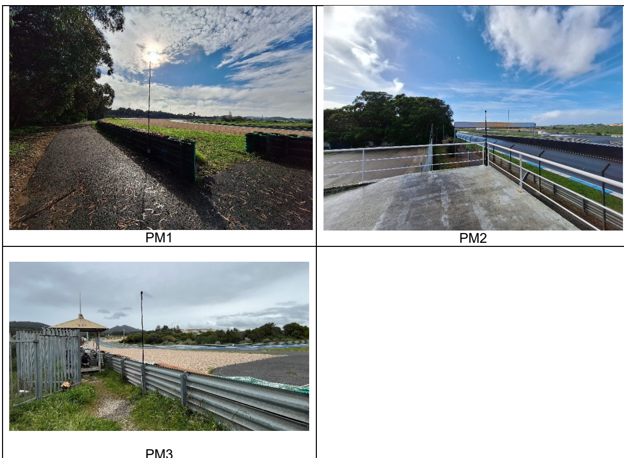
Figura 1 – Localização e fotos dos pontos de monitorização.